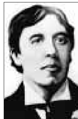
Obras de Oscar Wilde nos catálogos de editoras brasileiras: