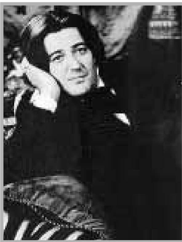
O mordaz e agressivo Oscar Wilde foi vivido por Stephen Fry (D), no filme "Wilde", de Brian Gilbert

Os grupos humanos marginalizados e perseguidos freqüentemente usam o humor como uma defesa contra o desespero, como acontece com os judeus. O humor judaico, no entanto, é rangente, melancólico. O humor irlandês, ao contrário, é mordaz, agressivo até. Nesse sentido, as tiradas de Wilde, coletadas em várias antologias, são um exemplo, sobretudo quando se referem aos ingleses. Eis como Wilde descreve um lorde na tradi-